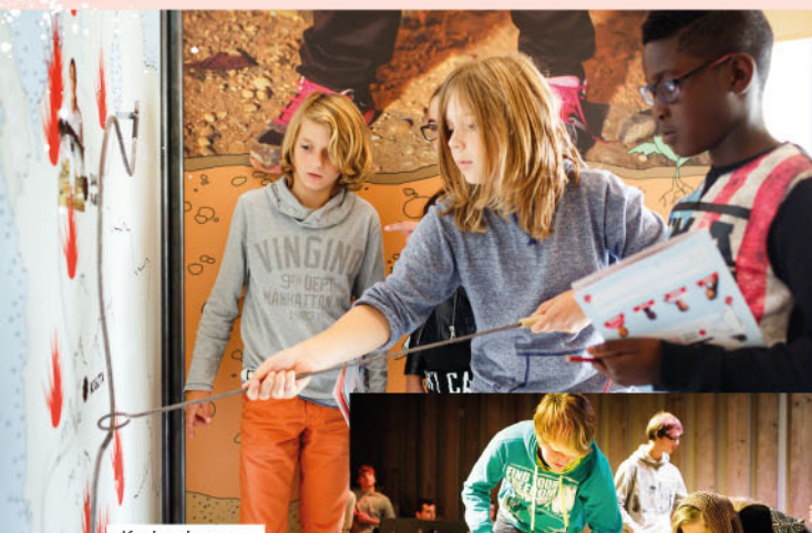
Kind onder vuur

In deze programma's leren leerlingen en studenten - altijd vanuit een menselijk perspectief - over onderwerpen als oorlog, vluchten en noodhulpverlening. We laten ze ervaren hoe het is om betrokken te zijn bij grote humanitaire vraagstukken en welke invloed dat heeft op iemands leven. Ook helpen we jongeren om een mening te vormen over de dagelijkse actualiteit en over het belang van vrede en veiligheid in de wereld.