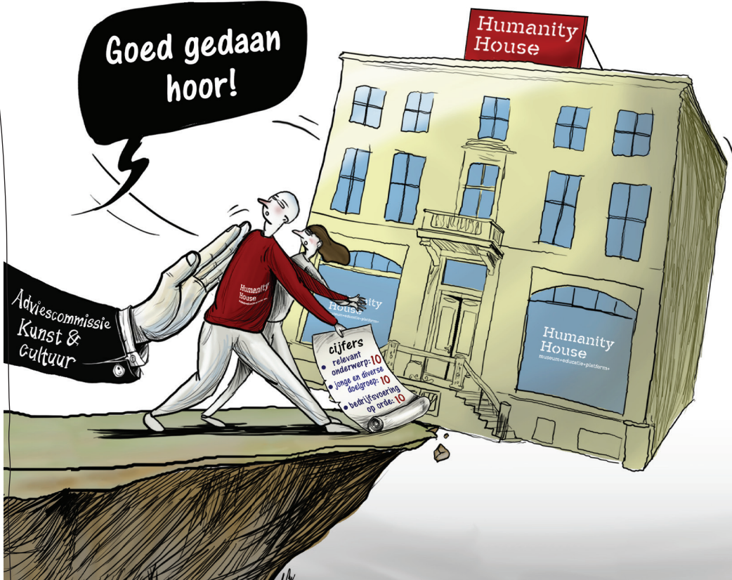
Cartoon door Sameer Khalili